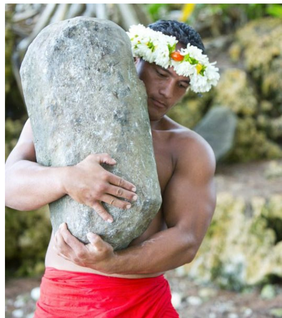
Insel Rurutu „Steineheben“