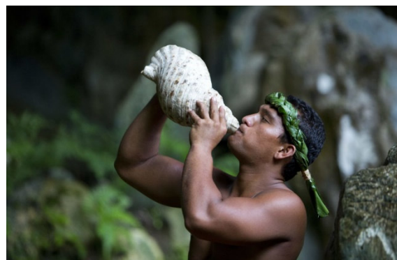
Insel Tubuai - Muschelbläser