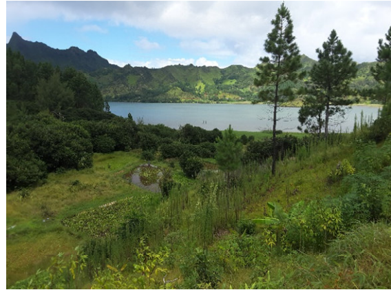
Insel Rapa – Wanderung um die Bucht von Ahurei

Das milde Klima macht diese Inseln auch ideal für die Landwirtschaft. Schon die ersten Entdecker waren von der Schönheit der Insel beeindruckt: Gegen Ende des 19. Jahrhunderts fanden die Abenteurer Wallis und Cook