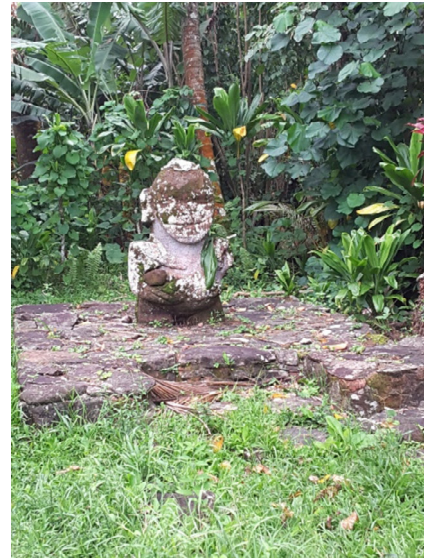
Insel Raivavae – lächelnder Tiki