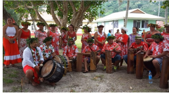
Insel Raivavae - Begrüßung

Heute lebt man vom Fischen und von der Viehzucht. Während unseres Besuches werden Sie mit einzigartigen Tänzen begrüßt. Sie können dann aus zwei Wanderungen wählen. Eine führt Sie vom Dorf Area entlang einer beeindruckenden Bucht zum Hauptort Ahurei, die andere zu den Überbleibseln einer alten Bergfestung.