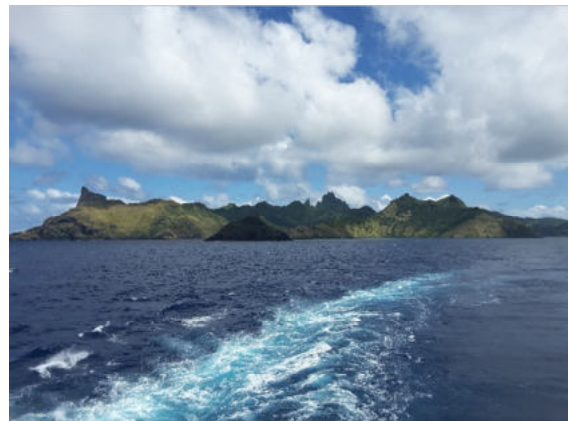
Au revoir, Rapa

Auf jeden Fall sollte man das Essen nicht verpassen!