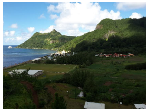
Insel Rapa – Wanderung um die Bucht von Ahurei

Es kann durchaus sein, dass unser Kapitän Sie auf Rapa mit den Worten „Willkommen auf Rapa, nächster Stopp: Antarktis“ begrüßt. Die südlichste bewohnte Insel ist nur per Schiff erreichbar, sichelförmig und besticht durch ihre Küstenlinie mit vielen Fjorden und zwölf Buchten. Abgelegener geht es nicht in Französisch-Polynesien!