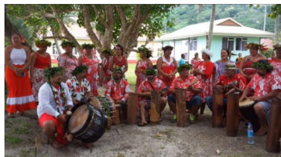
Insel Raivavae - Begrüßung