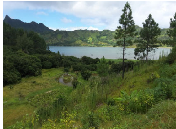
Insel Rapa – Wanderung um die Bucht von Ahurei

Weitere Aktivitäten, die während unseres anderthalbtägigen Zwischenstopps in Rapa angeboten werden, sind ein Besuch in Ahurei, das Hauptdorf der Insel, Anschauen alter Festungen, Besuche des landwirtschaftlichen Produktionszentrum, Entdecken des lokalen Kunsthandwerk, Treffen mit den Bewohnern der Insel, und genießen Sie ein über dem Holzfeuer zubereitetes Festmahl Ma'a im Dorf.