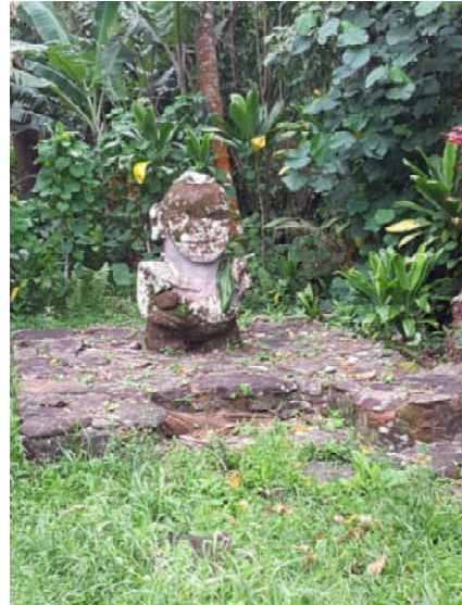
Insel Raivavae – lächelnder Tiki

Genießen Sie den schönen Strand von Mahanatoa und probieren Sie dabei köstliche Früchte.