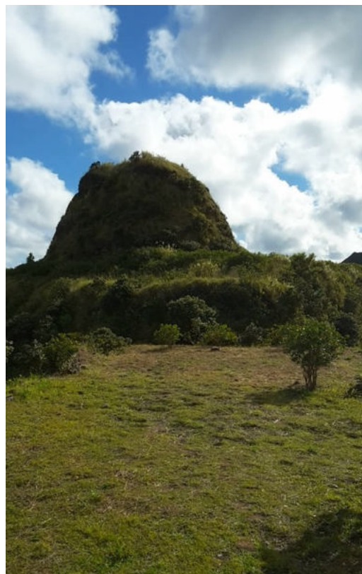
Insel Rapa – restauriertes Fort Morongo Uta

Heute lebt man vom Fischen und von der Viehzucht. Während unseres Besuches werden Sie mit einzigartigen Tänzen begrüßt. Sie können dann aus zwei Wanderungen wählen. Eine führt Sie vom Dorf Area entlang einer beeindruckenden Bucht zum Hauptort Ahurei, die andere zu den Überbleibseln einer alten Bergfestung. Ein traditionelles Mittag-