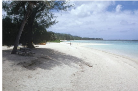
Rarotonga – einer der vielen schönen Strände der Inseln

Ihr Besuch auf der „Perle des Pazifiks“ beginnt mit einem unvergesslichen Picknick auf dem paradiesischen Motu Tapu.