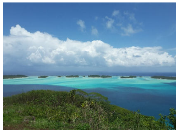
Bora Bora – zauberhafte Lagune