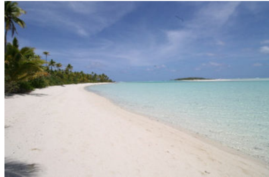
Aitutaki - One Food Island

Kulinarisch sind zahlreiche landwirtschaftliche Erzeugnisse von Atiu zu empfehlen, allen voran der Kaffee der Insel.