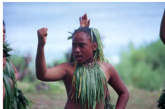
Cook Islander – Typische Verabschiedung mit Musik und Tanz