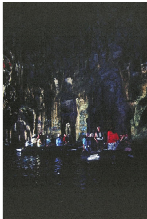
Atiu – Höhlenbesichtigung