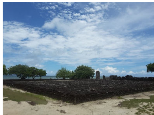
Insel Raiatea - Marae Taputapuatea