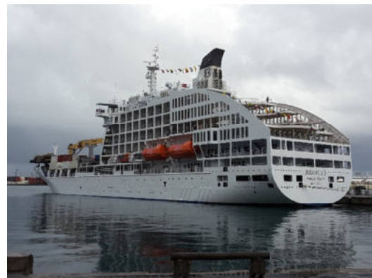
Aranui 5 am Kreuzfahrt-Terminal in Papeete (Tahiti)

Während des Aufenthaltes auf der Insel gibt es Gelegenheit für einen Stadtbummel durch Uturoa, der kleinen Hauptstadt, zum Besuch des Marae Taputapuatea und zu einer ca. 45 Minuten (pro Weg)-Wanderung auf den Hausberg (Mount Tapioi) mit fantastischen Ausblicken zu den Nachbarinseln.