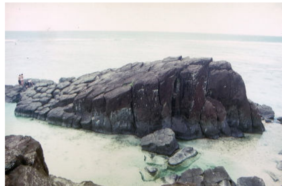
Rarotonga – Black Rock – Heiligtum und Spielplatz zugleich