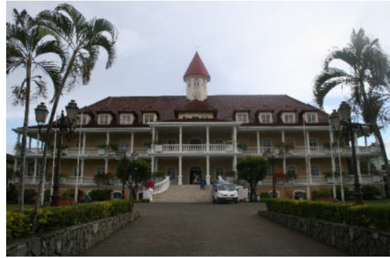
Papeete – Rathaus

Nach Anlegen am Frachthafen-Pier Motu Uta beginnt die Ausschiffung.