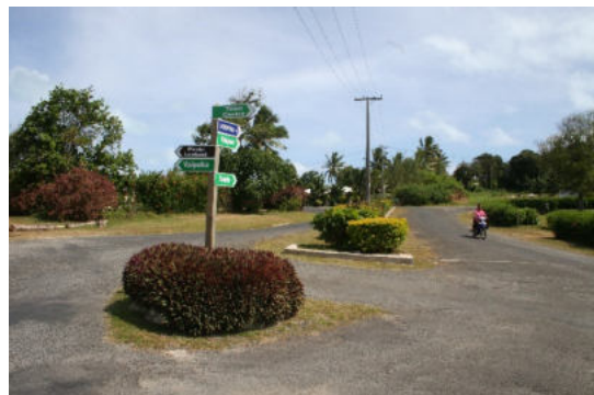
Aitutaki – Arutanga „Stadt“-Bummel