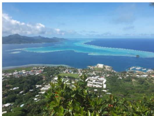
Insel Raiatea – Blick vom Mount Tapioi auf Uturoa und Tahaa