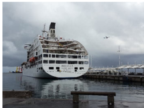
Die Aranui 5 am Kreuzfahrt-Terminal in Papeete

Kauehi, das erst kürzlich für den Tourismus geöffnet wurde, wird Sie mit seiner Authentizität und den surrealen Farben seiner Lagune verführen, die Sie genießen können, als ob Sie allein auf der Welt wären!