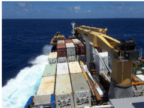
Aranui 5 - ein Passagier- und Frachtschiff