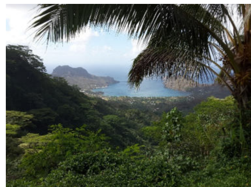
Blick auf die Bucht von Taiohae, Nuku Hiva