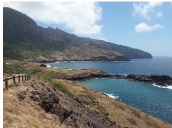
Ua Huka – auf dem Weg nach Hane