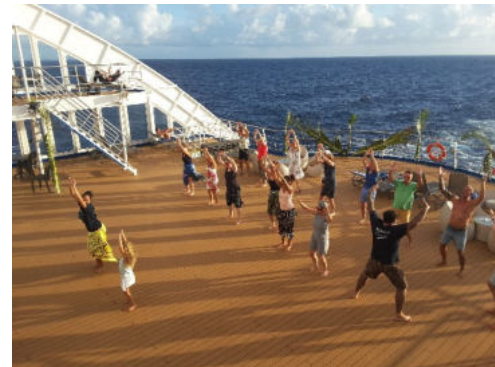
Tahitianischer Tanzkurs auf dem Sonnendeck