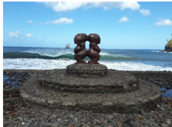
Fatu Hiva – Omoa