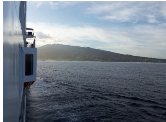
Rückkehr der Aranui 5 nach Papeete (Tahiti)

Anschlussprogramme eine früheste Abfahrt am Hafen für 07:15 Uhr zu planen (Weiterflüge ab Flughafen Papeete nicht vor 10:30 Uhr).