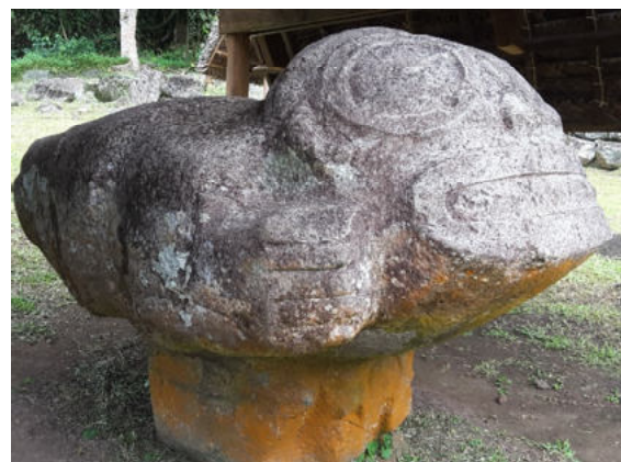
Hiva Oa – Puamau – Mea'e l'ipona

Die meisten einheimischen Männer – und auch einige der Frauen – schnitzen außerordentlich schöne Tiki-Figuren, Ketten, Armbänder und weitere Schmuckstücke aus Pferde- und Kuhknochen, Fossilien und Muschelschalen.