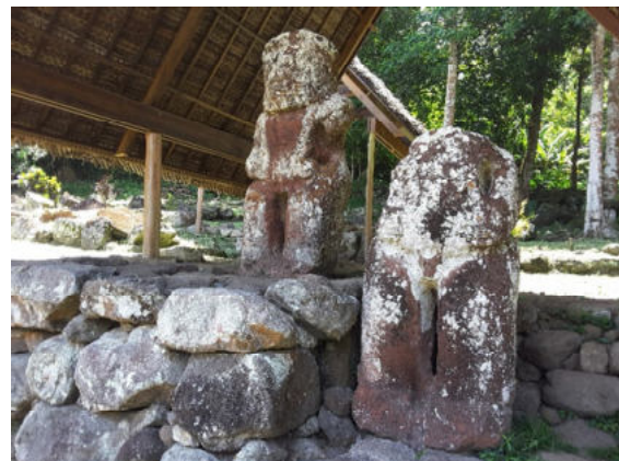
Hiva Oa – Puamau – Mea'e l'ipona

Am Nachmittag besuchen Sie die beeindruckende Kirche von Tahuata. Das große Gotteshaus, das der Vatikan bauen ließ, ist mit detailreichen Schnitzereien und einem Fenster aus Buntglas dekoriert, welches das marquesanische Kreuz zeigt.