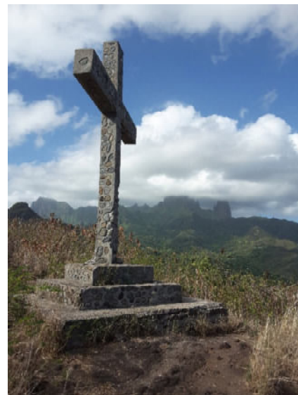
Wanderung zum Kreuz oberhalb Hakahau's