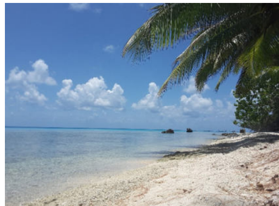
Rangiroa – Korallen-Sandstrand