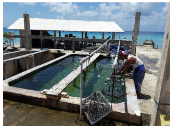
Rangiroa – Perl-Austernfarm