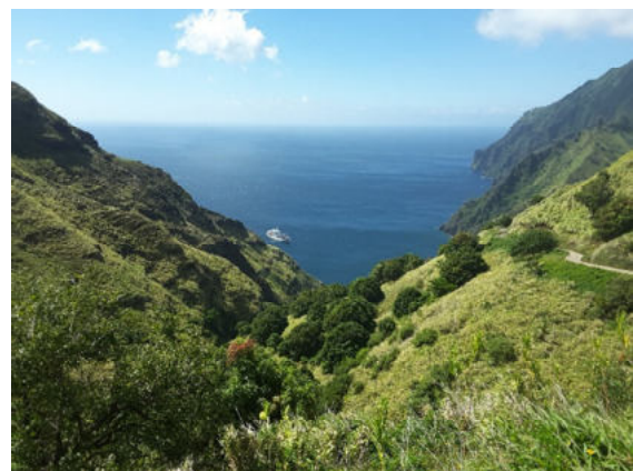
Fatu Hiva – auf der Wanderung von Omoa nach Hanavave