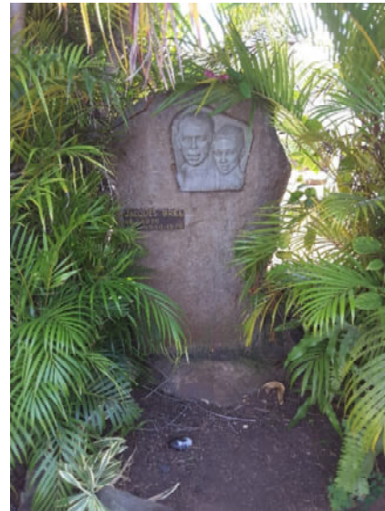
Hiva Oa – Atuona – Grabstelle Jacques Brel

Besuchen Sie das Gauguin-Museum, ein Nachbau seines „Haus der Freude“, und statten Sie auch dem Brel-Museum einen Besuch ab. Hier können Sie einen Blick auf sein Flugzeug JoJo werfen, das oft für medizinische Notfälle genutzt wurde.