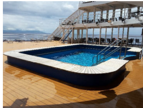
Aranui 5 Pool- und Sonnendeck

Ein zusätzlicher Tag, um an den kulturellen Aufführungen des Marquesas Art Festival teilzunehmen.