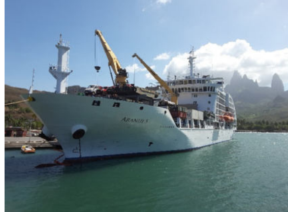
Die Aranui 5 am Pier in Hakahau

ein marquesisisches Mittagessen serviert. Nachmittags ist eine Wanderung möglich, auf der Sie Tikis aus rotem Tuffstein entdecken werden.