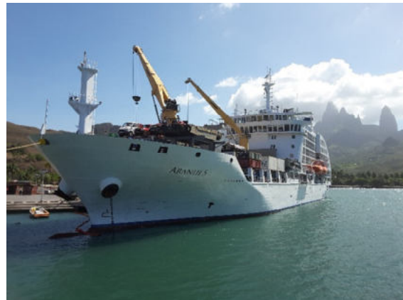
Die Aranui 5 am Pier in Hakahau

Nachmittags ist eine Wanderung möglich, auf der Sie Tikis aus rotem Tuffstein entdecken werden